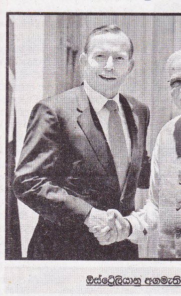
මීස්ට්‍රේලියානු අගමැති හමුවක්

එමෙන්ම ගෝලීය බලවතා වූ ඇමරිකා එක්සත් ජනපදය සමඟ සම්ප සබඳතාවයක් මෝදිගේ පාලනය විසින් ඇති කරගනු ලැබූ අතර එය ප්‍රජාතන්ත්‍රවාදය මුල්කරගත් දැක්මක් මත පදනම් විය. මේ අනුව 2014 සැප්තැම්බර් 26-30 යන දින එක්සත් ජාතීන්ගේ මහා මණ්ඩල සැසිවාරයේදී සම්ප්‍රදායෙන් ඔබ්බට ගමන් ඇමරිකානු ජනාධිපති බරේක් ඔබාමා මෝදි හමුව දෙරට අතර නව සබඳතා ශක්තිමත් කර ගැනීමට ඉවහල්විය. එසේම සිය ඇමරිකානු සංචාරය තුළදී දෙවරක් ඇමරිකා ජනාධිපතිවරයා හමු වූ මෝදි ඉන්දියානු 66 වන ජනරජ දිනයේ ප්‍රධාන ආරාධිතයා වශයෙන් සහභාගිවන ලෙස ඔහුට ආරාධනා කළේය. එය ඇමරිකානු ජනාධිපතිවරයෙකු ඉන්දියානු ජනරජ දිනයට ප්‍රධාන ආරාධිතයා ලෙසට සහභාගි වූ ප්‍රථම අවස්ථාව විය. එසේම එය මෝදි බලයට පත්වීමෙන් පසුව ඇමරිකානු ජනාධිපතිවරයාගේ පළමු ඉන්දීය විදේශ සංචාරය වීම ද වැදගත්විය. මේ අනුව 2015 ජනවාරි 26 වන දින ඉන්දියානු ජනරජ දිනයට ප්‍රධාන අමුත්තා ලෙසට සහභාගි වෙමින් දෙරට අතර නව මානයකින් යුතු සබඳතා ඇතිකර ගැනීම පිළිබඳව ලෝකයේ විශාලතම ප්‍රජාතන්ත්‍රවාදී රාජ්‍යයන් දෙක ඉඳි පළ කළේය. ඉන්දියාව තම මෘදු බලය ජාත්‍යන්තර තලය තුළ ප්‍රදර්ශනය කරමින් නව ගෝලීය බලවතෙකු ලෙසට දකුණු ආසියානු අනන්‍යතාවකින් ප්‍රවේශ වීමට දරනු ලැබූ උත්සාහය ඉන්දියාවේ නැගෙනහිර බල ප්‍රතිපත්ති සම්පාදන ක්‍රියාවලිය හා සමගාමී වේ.