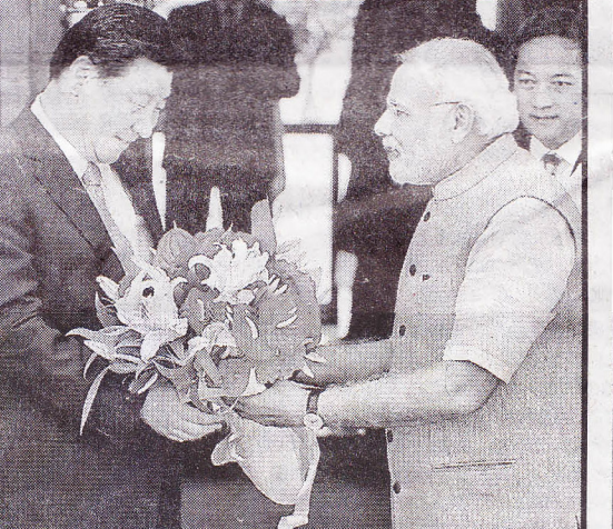
වින ජනපති හමුව

පසුගාමී වූ ඉන්දු - ශ්‍රී ලංකා සබඳතා නව මානයකට ගෙනයාමට සමත්විය. ජනාධිපති මෛත්‍රීපාල සිරිසේන 2015 පෙබරවාරි මස 15-18 සිව් දින නිල සංචාරයට පෙර ඉන්දීය තම්බිනාඩු ධීවරයින් නිදහස් කිරීම දෙරට අතර නව රාජ්‍යකන්ත්‍රීය සබඳතා ඇතිවීම සඳහා වූ පුර්ව පිටු බලයක් විය. දෙරට අතර ද්විපාර්ශ්වික සාකච්ඡාවලදී ප්‍රජාතන්ත්‍රවාදය ස්ථාපිත කිරීම, නිදහස මෙන්ම නව ආර්ථික හා බලකෙති අවශ්‍යතාව සඳහා මුලිකත්වය ලබාදීම දැකිය හැකිවිය. ඒ අතරින් සංචාරක හා පුනර් බලකෙති ප්‍රභවයන් සම්බන්ධයෙන් දෙරට අතර වඩා නව ප්‍රතිපත්තියක් අනුගමනය කිරීම පිළිබඳවද සාකච්ඡා කෙරිණ. එමෙන්ම සංචාරක හා ආර්ථික ආයෝජන ඉහළ දැමීම පිළිබඳව ඉන්දීය අගමැතිවරයා ශ්‍රී ලංකාව වෙත ධනාත්මක ප්‍රතිචයක් ලබා දුන්නේය. එක්සත් ජාතීන්ගේ මානව හිමිකම් සැසිය තුළ ශ්‍රී ලංකාවට අවශ්‍ය කරනු ලබන කාල රාමුව ලබාදීම හරහා නැවතත් ඉන්දු - ලංකා සබඳතා ශක්තිමත් කිරීමට මුල පිරීම දෙරටටම ජාත්‍යන්තර සබඳතා තුළ වැදගත්විය. එසේම නව ජනාධිපති මෛත්‍රීපාල සිරිසේන හා විදේශ අමාත්‍ය මංගල සමරවීරගේ ආරාධනය පිළිගෙන ශ්‍රී ලංකාවට පැමිණීම වසර 28 කට පසු ඉන්දීය අගමැතිවරයෙකු මෙරට කරනු ලබන ප්‍රථම සංචාරය වෙයි. ඒ හරහා ඉන්දීය රාජ්‍ය නායකයා කෙරෙහි විශේෂ පැහැදිලිමක් ශ්‍රී ලාංකිකයින් අතර ඇතිවීමේ