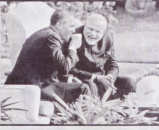
ජනාධිපති ඔබාමා හමුව මොහොතක්

ඉන්දියානු විශේෂ අවස්ථාවක් සඳහා ලද ප්‍රධාන පෙලේ ආරාධනාවක් විය. මීට අමතරව සිය සම්පස්ථ ගෝලීය ප්‍රතිවාදියා වූ චීනයේ විරෝධතාව නොසලකා ටිබෙටයේ අන්තර්වාර ආණ්ඩුවට ආරාධනා කිරීමෙන් සිය ආරම්භය දකුණු ආසියානු කලාපය තුළ නව ප්‍රවණතාවලින් යුතු වූ